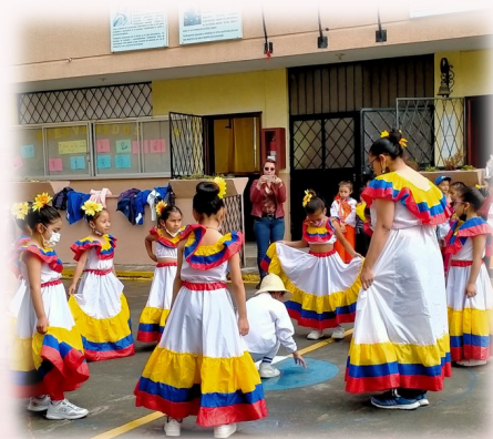
Esibizione dei bambini in danze tradizionali come espressione di accoglienza.