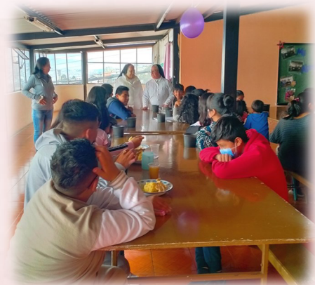
Incontro con i catechisti e gli anziani del "Comedor", centro per la dispensa gratuita della mensa.