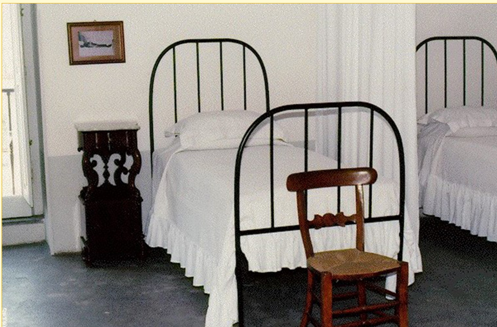
Pompei. Casa "Padre E. Montemurro": Camera di don Eustachio.

Il lungo viaggio di ritorno ci ha dato la possibilità di esprimere e condividere riflessioni e risonanze sulla giornata vissuta insieme. Al tempo stesso, perché questa non resti una esperienza fine a se stessa, ci siamo prefissati degli