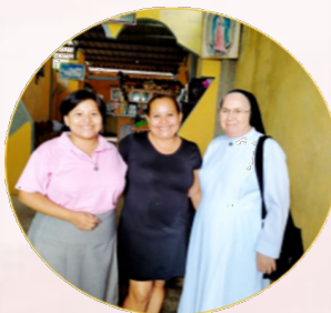
Mamma di Anais