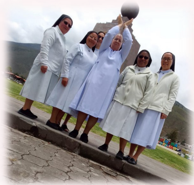
Visita alla "Metà del Mondo"