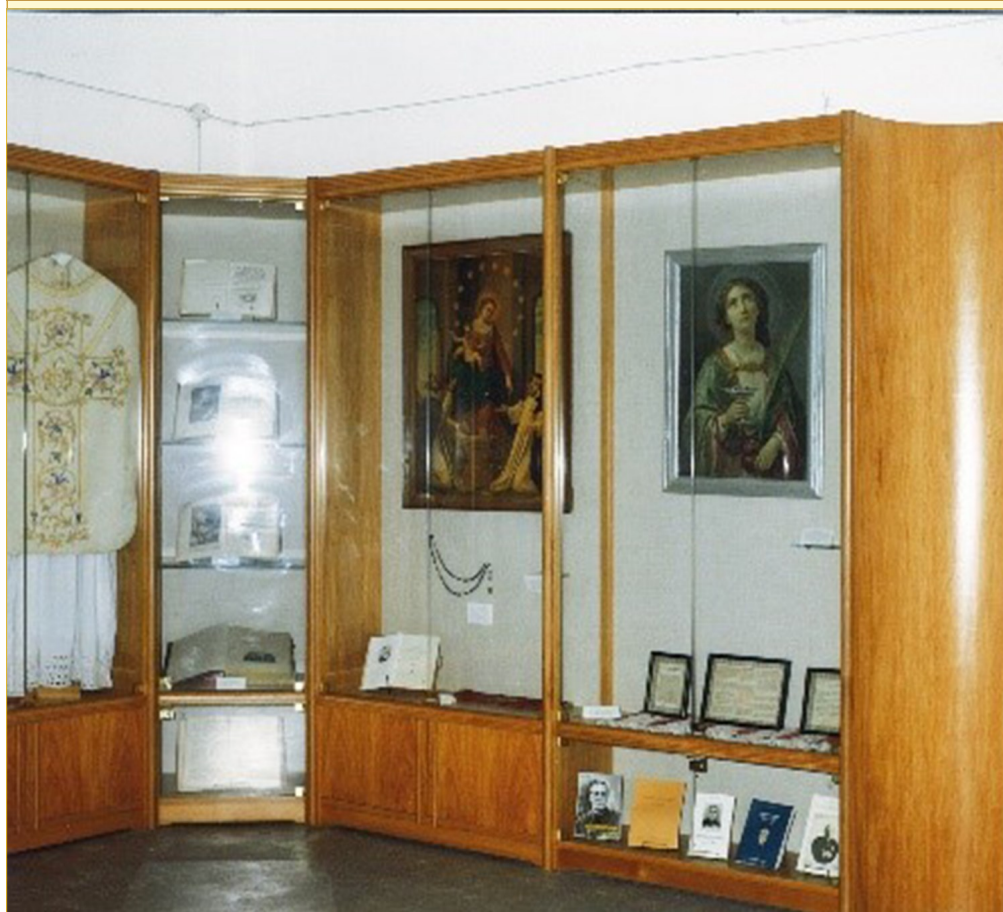
Pompei. Casa “Padre Eustachio Montemurro”: Sala ricordi.

E questo nell’intento di continuare tutti insieme il nostro cammino, in un clima di amicizia e di reciproca collaborazione. ■