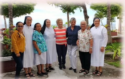
Manta: incontro con gli Associati